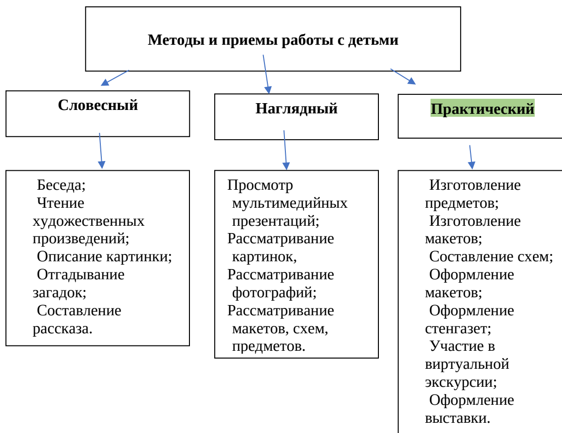
Рис.1. Методы работы с детьми.

Прием - конкретная операция взаимодействия воспитателя и воспитанника в процессе реализации метода обучения.